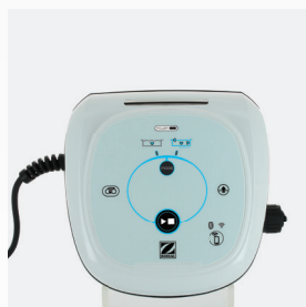
Boîtier de commande