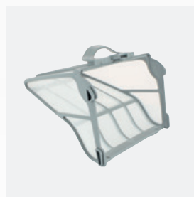
Bac filtrant Filtre très fin rigide de grande capacité (5 litres)