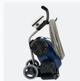
Chariot de transport